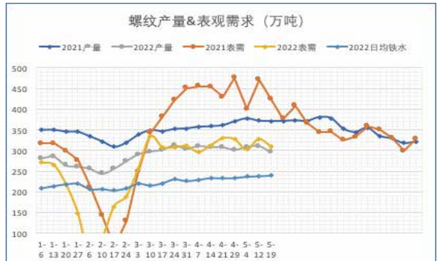
表观需求和产量都大幅低于去年同期，供需双弱。

本月价格继续上涨，截止到21号，杭州中天报4780，跌330；上海三洲报4620，跌280；合肥长江报4830，跌180；南昌方大报4540，跌290；沈阳抚顺报4660，跌290；河北敬业报4760跌340。上海热卷价格报4830，跌350。