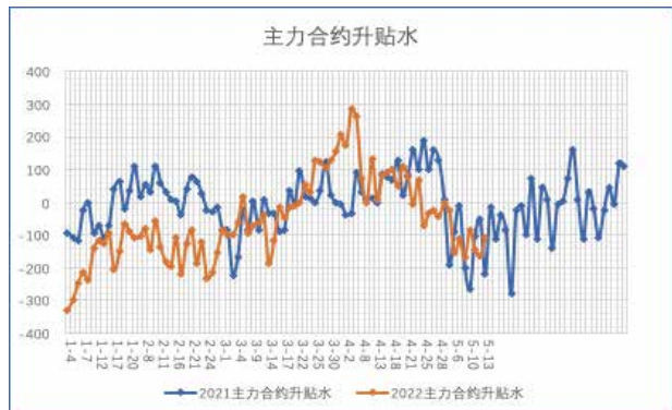
期货持续维持贴水，并且贴水幅度有加大的趋势。