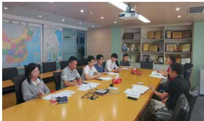
第八工程事业部分享交流中

项目经理和自己所负责的项目之间的对接也是如此，因为分工不同、立场不同，各自的盈利点也不同，很难产生共情，真正站在彼此的角度考虑问题。