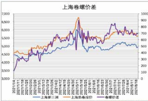
本月价格有所回调，上海、南昌等区域价格再次回到5000以下，热卷相对强势，价格依然接近6000。