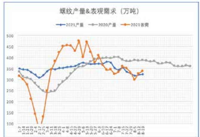
钢厂产量持续低于去年同期，限产对产量的影响明显，表观需求有回升迹象。

本月价格有所回调，截止到20号，杭州中天报5050，跌250；上海新三洲报4930，跌240；合肥长江报5120，跌200；南昌方大报4900，跌190；沈阳抚顺报5050，跌100；河北敬业报5030跌200。上海热卷价格报5620，跌280。