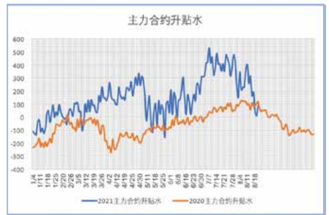
月末期货突然快速下跌，现货涨幅相对有限，期货由原来的大幅升水变为基本与现货平水。