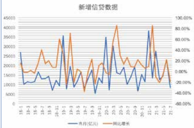
社融数据较差，M2增速8.3%环比回落0.3个百分点，新增人民币贷款0.84万亿，同比、环比均大幅下滑。