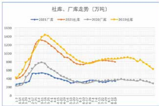
本月库存数据显示，社会库存开始慢慢下降，已经低于去年同期，单从库存数据来看，今年供应压力小于去年。