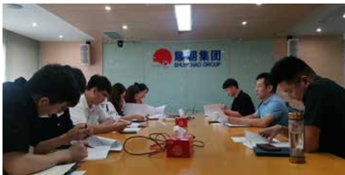
工程二部内部就《干好工作18法》进行讨论学习